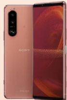
Sony Xperia 5 III 256G