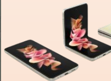
Samsung Flip 3 5G