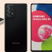
Samsung A52s 5G