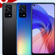
OPPO A55 $1,490