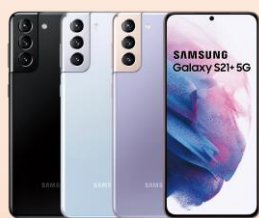
Samsung GALAXY S21+