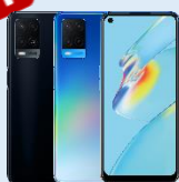
OPPO A54 $490