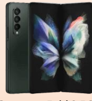
Samsung Fold 3 5G