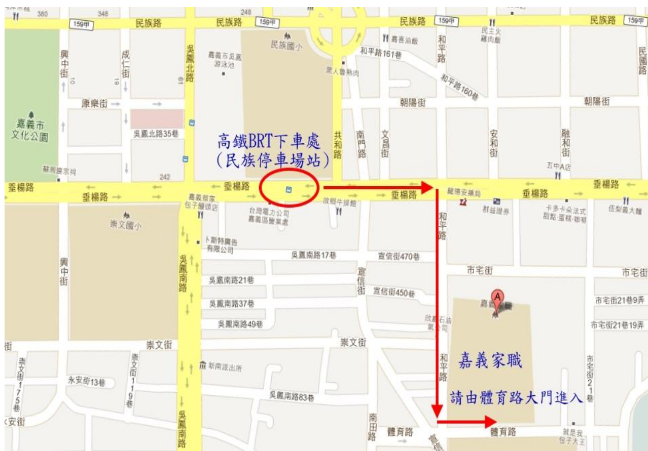
附圖一 承辦學校位置圖