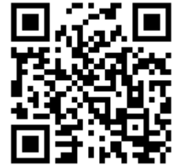
活動 QR 碼